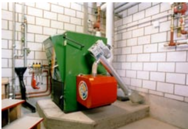
Chaudières à granulés pour bâtiments d'habitation et industriels.

La sciure et les copeaux provenant de scieries constituent la matière première pour la fabrication des granulés de bois. Seul le bois non traité peut être utilisé. La matière première est comprimée en bâtonnets de quelques millimètres de diamètre sous haute pression sans adjonction d'agglomérant. Il en résulte un combustible compact à haut pouvoir calorifique. Rapporté au volume du combustible en vrac, le contenu énergétique est environ quatre fois supérieur à celui des copeaux. Cela réduit d'autant la taille du silo et le nombre de livraisons de combustible. L'énergie nécessaire à la production dépend du taux d'humidité de la matière première. Elle se situe entre 1,3 % et 2,7 % du pouvoir calorifique. Le label de qualité «SWISS-PELLET» d'Energie-bois Suisse garantit une bonne qualité du combustible.