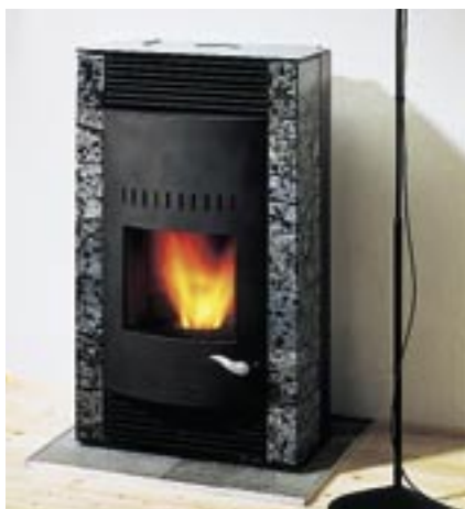
Poêle de salon à granulés: chargement manuel, chauffage automatique.