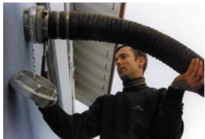
Livraison de granulés par camion-citerne.

Poêles de salon et d'étage: La puissance des petits chauffages à granulés se situe entre 2 kW et 11 kW. Vus de l'extérieur, ils sont identiques aux poêles-cheminées conventionnels. Leur fonctionnement est par contre automatisé, par exemple à l'aide d'un thermostat d'ambiance. L'allumage s'effectue par simple pression d'un bouton, l'ouverture et la fermeture des clapets de ventilation sont gérées par un microprocesseur. Le travail requis