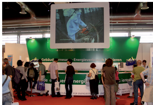
L'efficacité énergétique des bâtiments et le stand de SuisseEnergie attirent la foule.

www.fachmessen.ch/bauen / www.bien-construire.ch